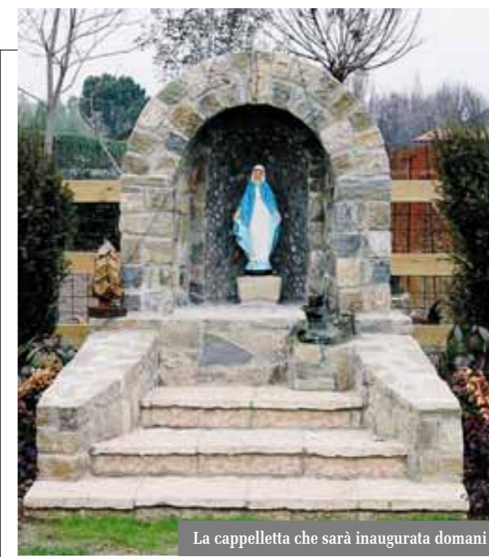
La cappelletta che sarà inaugurata domani